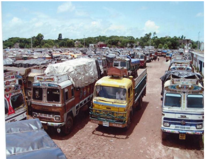
বেনাপোল স্থলবন্দরের ট্রাক টার্মিনাল