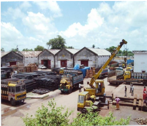
বেনাপোল স্থলবন্দরের অপারেশনাল কার্যক্রম